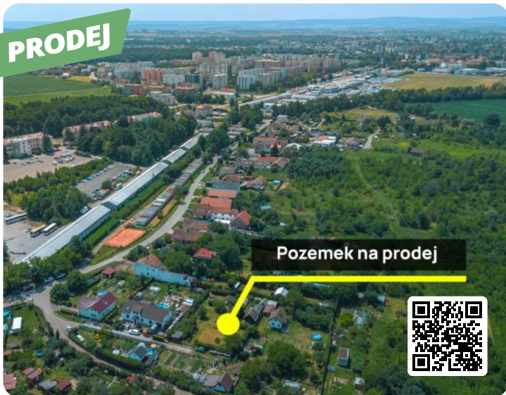
Pozemek na prodej