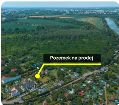
Pozemek na prodej

Hledáte dokonalé místo pro svůj budoucí domov nebo zajímavou investici? Nabízíme k prodeji výjimečný stavební pozemek o rozloze 1240 m 2 ve velmi vyhledávané a klidné lokalitě Pardubice – Hůrka. Proč si vybrat právě tento pozemek? Hůrka se nachází na východním okraji Pardubic, v těsné blízkosti řeky Labe – ideální pro procházky, sport i relaxaci, nabízí tak dokonalý balanc mezi přírodou a městským životem. Do centra Pardubic se dostanete během několika minut, Hůrka je plně obsluhována pravidelnou linkou MHD. Inženýrské sítě a stav pozemku - Podle platného územního plánu je pozemek určen k výstavbě rodinného bydlení. - Elektrina je již přivedena přímo na pozemek. - Voda: Na pozemku se nachází vlastní kopaná studna s užitkovou vodou. - možnost napojení na obecní kanalizaci Součástí prodeje jsou také drobné stavby - chata, sklad, altán, skleník a již založená a vzrostlá zahrada s ovocnými i okrasnými stromy. Máte zájem o prohlídku nebo potřebujete více informací? Neváhejte mě kontaktovat, rád vám sdělím veškeré detaily.