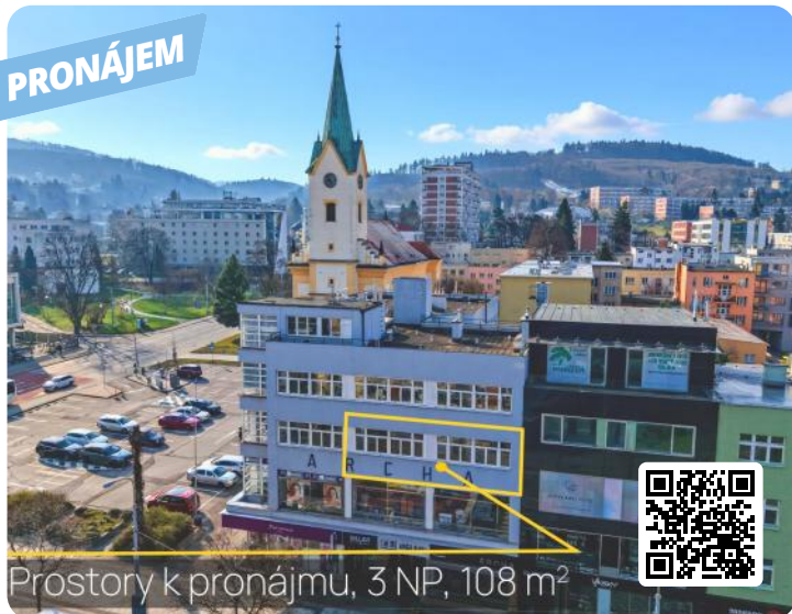
Prostory k pronájmu, 3 NP, 108 m 2