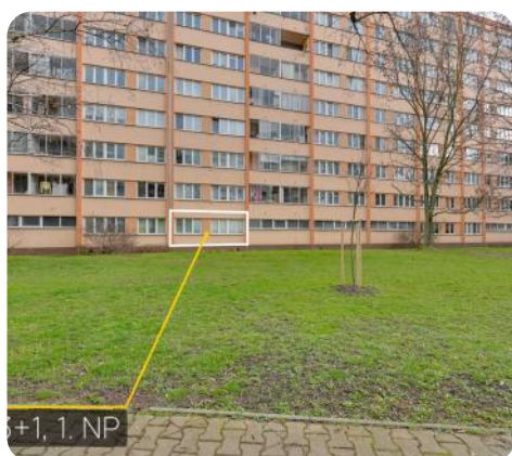
Byt 3+1, 1.NP