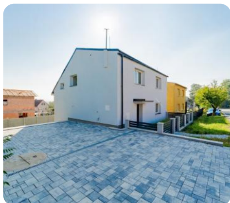
RODINNÝ DŮM 1.NP