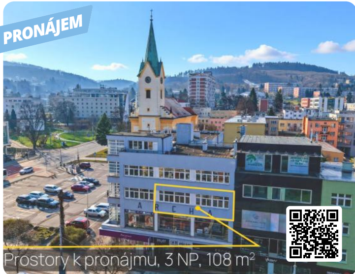
Prostory k pronájmu, 3 NP, 108 m 2