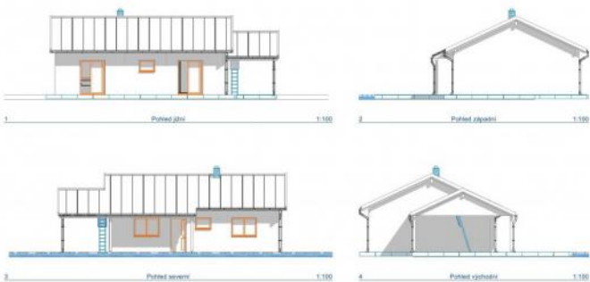
RD ALFA - dům 3+kk přízemní s krytým garážovým stáním a zastřešeným vchodem